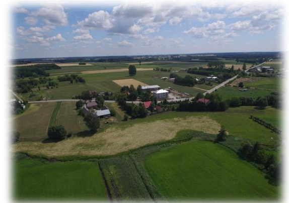
Widok z lotu ptaka, ul. Sportowa